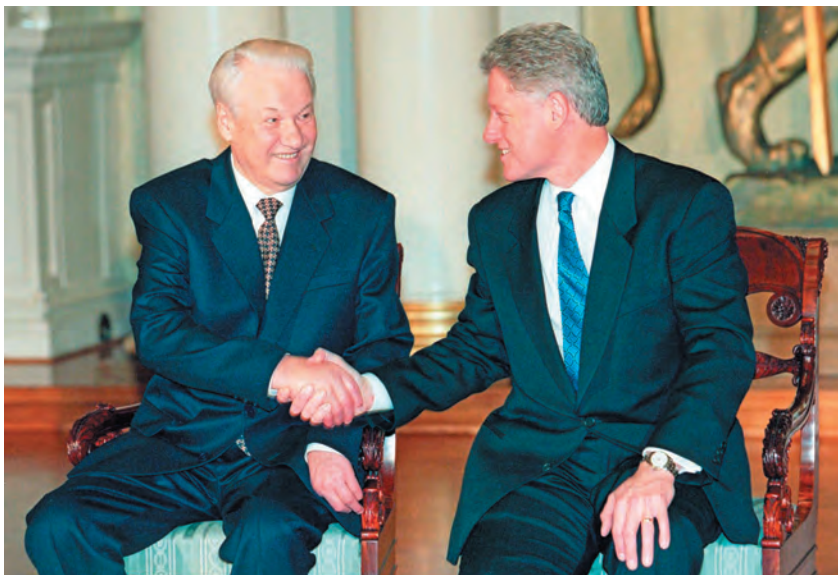
Întâlnirea dintre președinții Elțin și Clinton la Helsinki, 1997

După valul eliberator din 1989, teama față de Rusia a împins guvernele democratice instaurate în Europa Centrală și de Est să ceară cu insistență integrarea în NATO, iar puciul de la Moscova, din august, și destrămarea URSS, consfințită în seara de Crăciun a anului 1991, au împiedicat pentru o vreme planurile de recâștigare a dominației în fostele țări-satelit.