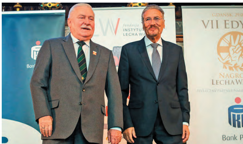
Cu fostul președinte al Poloniei, la Gdansk, în juriul Premiului Lech Wałęsa pentru pace

Am scris această scrisoare deoarece, în calitate de intelectuali din Centrul și Estul Europei, dar și de formatori de opinie, suntem preocupați de viitorul relațiilor transatlantice și de calitatea viitoarelor relații dintre Statele Unite și țările din regiunea noastră. Vă scriem în nume personal, ca prieteni și aliați ai SUA, dar și în calitate de persoane implicate în activitățile europene.