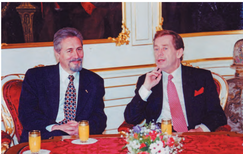
Împreună cu scriitorul, disidentul și fostul președinte al Cehiei, Vaclav Havel, Praga, 2004

Și în Centrul și Estul Europei au loc schimbări ale conducerilor. Acei lideri care au provenit din revoluțiile din 1989 și au cunoscut rolul-cheie pe care l-a jucat Washingtonul în asigurarea tranziției noastre spre democrație și în includerea țărilor noastre în NATO și UE se retrag încet, dar sigur, de pe scena politică. Tulburările actuale din politică și economie, ca și apropierea crizei economice mondiale aduc cu ele și alte oportunități favorabile forțelor naționaliste, extremiste și antisemite de pe continent, dar și din țările noastre. Acest fapt înseamnă că Statele Unite își pot pierde interlocutorii tradiționali din regiune. Este posibil ca noile elite, care îi înlocuiesc, să nu împărtășească idealismul sau să nu aibă aceleași relații cu Statele Unite, cum s-a întâmplat cu generațiile care au condus în timpul tranziției spre democrație. Acestea ar putea fi mai calculate în privința sprijinului pe care să-l acorde Statelor Unite și să adopte un mod mai „parohial“ de percepție a lumii. În Washington are loc o tranziție similară, deoarece mulți lideri și personalități cu care am lucrat, și pe care ne-am bazat, se retrag din viața politică.