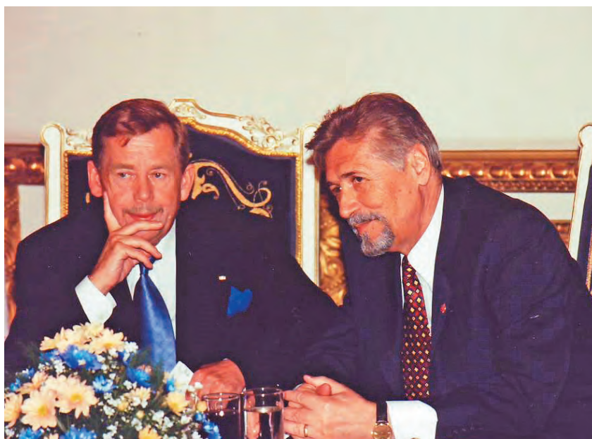
Václav Havel și Emil Constantinescu la Palatul Cotroceni, mai 2000