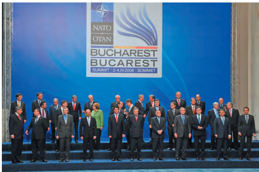
Fotografie de familie de la Summit-ul NATO, București, 2008

În zilele de 2-4 aprilie 2008, 26 de state membre ale Alianței Nord-Atlantice și 23 de țări semnatare ale Parteneriatului pentru Pace se reuneau la Palatul Parlamentului pentru Summitul cu cea mai mare participare din istoria NATO.