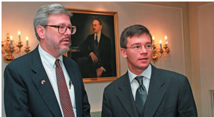
Ambasadorul SUA la București împreună cu secretarul de stat din cadrul Ministerului Afacerilor Externe, Mihai Răzvan Ungureanu