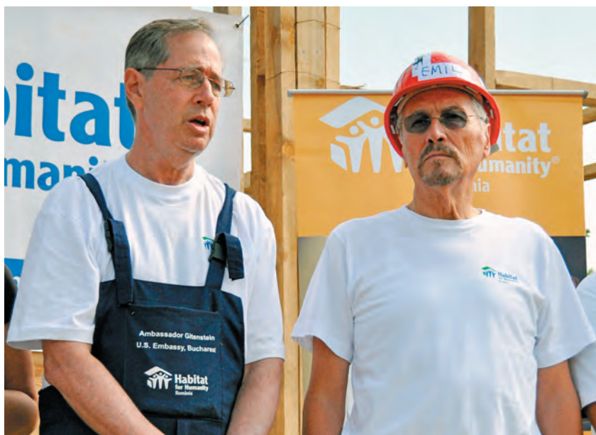
Ambasadorul SUA, Mark Gittenstein, și Emil Constantinescu, pe șantierul Habitat for Humanity, Pitești, 2010

Când am venit în România, vicepreședintele Statelor Unite, Joe Biden, mi-a spus că este aici un singur om la care trebuie să fiu atent, iar acel om este Emil Constantinescu. Mi-a spus că este un lider extraordinar, un om plin de compasiune și un om cu viziune. Așadar nu este doar o figură istorică, este un model pentru viitoarea generație de lideri din România.