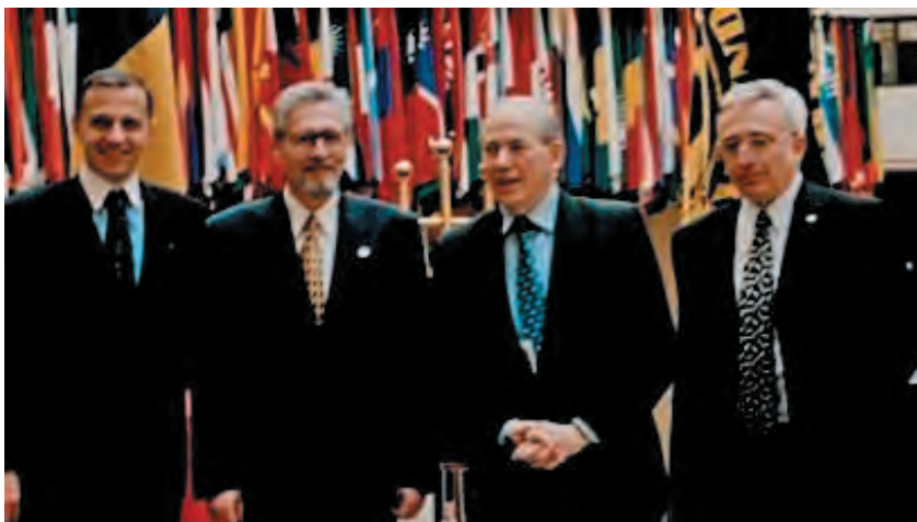
Directorul FMI, Michel Camdessus, primește delegația română la sediul din Washington

La începutul anului 1999, într-o conjunctură nefericită, Fondul Monetar Internațional declara că România are toate șansele să intre în încetare de plăți. Joseph Stiglitz, laureatul Premiului Nobel din 2001, pe atunci economist-șef al Băncii Mondiale, prezintă în detaliu acest caz în cartea sa Globalizarea. Speranțe și deziluzii și notează: „Un guvern mai corupt sau mai incompetent decât cel pe care îl avea România în acel moment ar fi acceptat condițiile inacceptabile ale Fondului Monetar Internațional. Guvernul acela, necorupt și competent, nu le-a acceptat și a reușit să treacă peste acel moment destul de dificil“.