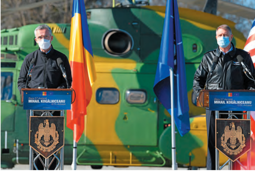
Vizita secretarului general NATO, Jens Stoltenberg, la Baza militară Mihail Kogălniceanu

Declarația comună dată publicității de guvernele Statelor Unite și României, la 10 noiembrie 2021, menționează caracterul simbolic al celei de-a șaptea runde a Dialogului strategic bilateral, instituit în anul 2012, care a avut loc când Statele Unite și România sărbătoreau a zecea aniversare a adoptării Declarației comune privind Parteneriatul Strategic pentru secolul XXI și semnarea Acordului privind amplasarea sistemului de apărare împotriva rachetelor balistice în România.