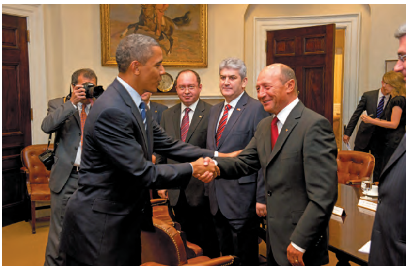
Președintele SUA, Barack Obama împreună cu delegația română condusă de președintele Băsescu

„De la lansarea sa, Parteneriatul Strategic a reprezentat un reper esențial al politicii externe a României, precum și un instrument eficient de sprijinire a eforturilor interne în domeniul reformei politice, economice, militare, administrative.