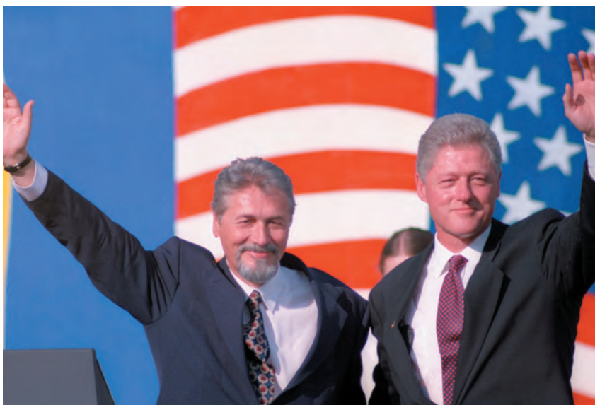
Piața Universității, 11 iulie 1997

Lansarea Parteneriatului Strategic cu Statele Unite este unul dintre momentele astrale din istoria României. Este imposibil de știut câți dintre cei peste 100 000 de participanți la discursurile susținute de Bill Clinton și Emil Constantinescu, care au umplut Piața Universității și împrejurimile – estimarea îi aparține președintelui american și apare în volumul său de memorii My life –, sau câți dintre milioanele de români care au urmărit transmisiunile în direct ale posturilor de televiziune se gândeau atunci la acest lucru, dar entuziasmul era autentic și vizita președintelui american la București, un eveniment plin de speranță.