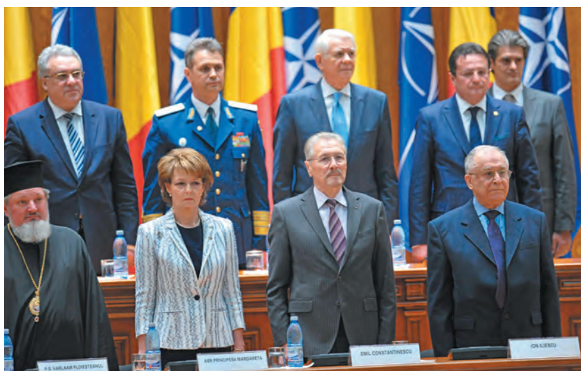
Ședința solemnă a Parlamentului României, aprilie 2014

O lună mai târziu, Parlamentul României se întrunea pentru a aniversa 10 ani de la admiterea în NATO și 65 de ani de existență a Alianței Nord-Atlantice. În declarația dată publicității se afirma: „Semnificația și importanța acestui moment ne apar cu atât mai evidente astăzi, când constatăm că amenințări de securitate pe care le consideram demult depășite în spațiul european, cum ar fi anexarea Crimeei de către Rusia, prin încălcarea dreptului internațional, revin în prim-planul actualității. Aceste evoluții îngrijorătoare, pe care România le condamnă cu fermitate, vin să reconfirme validitatea premiselor care au stat la baza aderării țării noastre la NATO“.