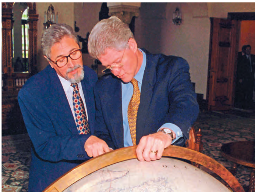
Palatul Cotroceni, 11 iulie 1997