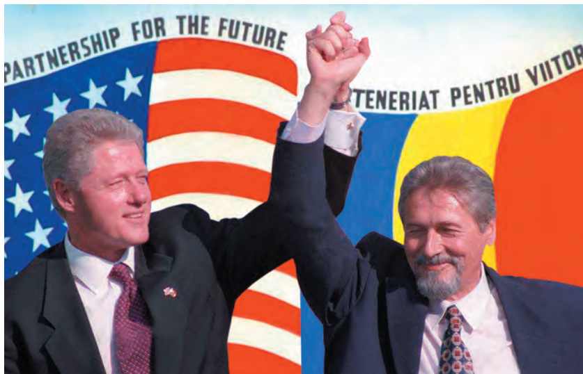
Piața Universității, 11 iulie 1997

În contextul războiului din Ucraina, este firesc ca atenția tuturor să fie îndreptată acum spre componenta de