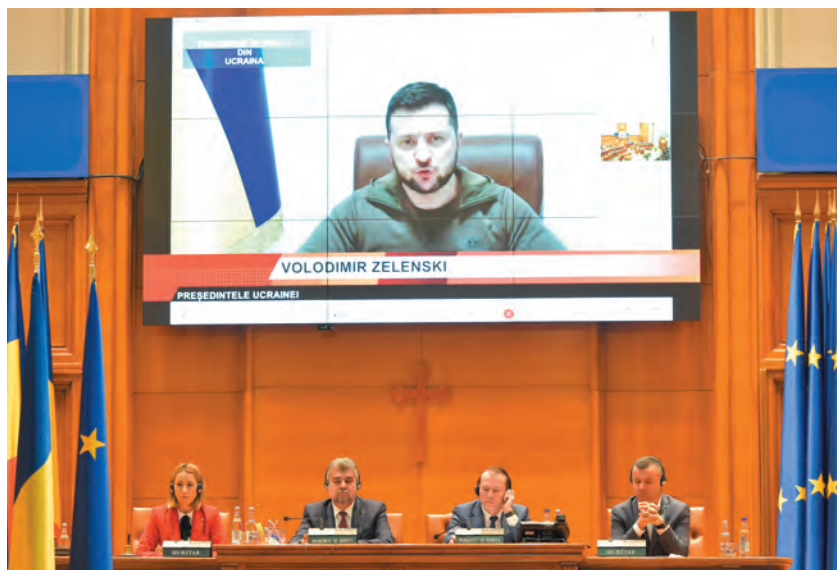
Volodimir Zelenski în Parlamentul României, 4 aprilie 2022