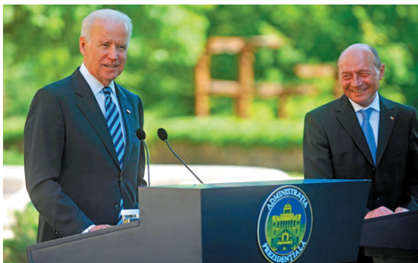
Vicepreședintele Joe Biden la București alături de președintele Traian Băsescu