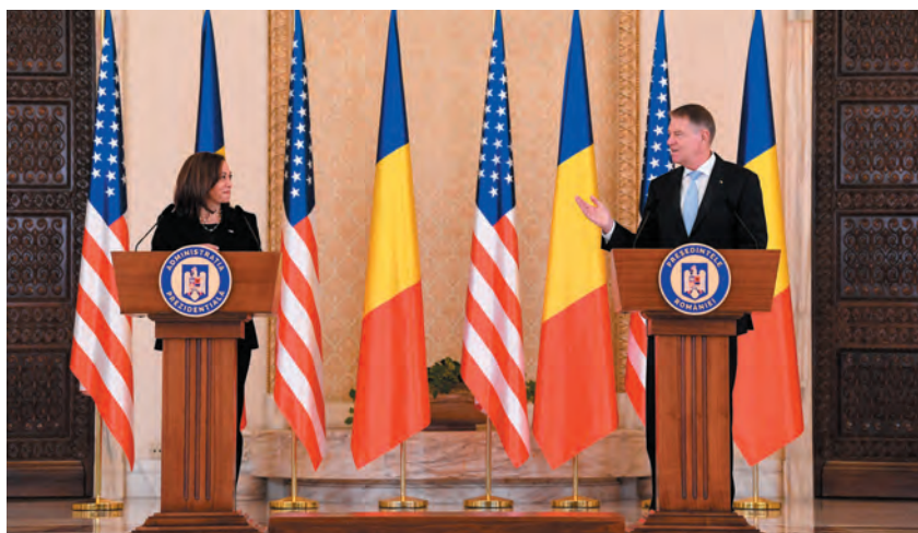
Kamala Harris la București, 2022

Aș vrea să mă adresez direct poporului român pentru a-i mulțumi, în numele Statelor Unite. Sub conducerea președintelui Iohannis, România a fost extraordinară prin generozitatea și curajul de care a dat dovadă în acest moment. Am urmărit cum ați primit refugiați. Știm despre provocările speciale cu