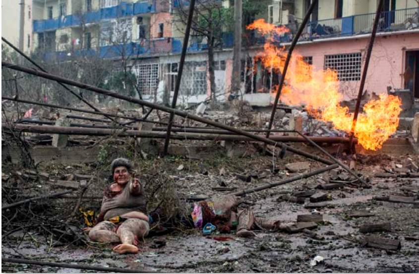
Imagine din Războiul ruso-georgian, august 2008

penitenciare a crescut numărul cazurilor de încălcare a drepturilor omului. Guvernul, la rândul lui, a ajuns să ignore din ce în ce mai mult opoziția și opinia publică, motiv pentru care nu a perceput în mod adecvat criticile societății. Toate aceste erori săvârșite în politica internă au atras o scădere drastică a gradului de simpatie de care se bucuraseră odinioară partidul de guvernământ și președintele Saakașvili în rândul georgienilor. O atare percepție avea să se reflecte întocmai la alegerile din 2012, când partidul de guvernământ „Mișcarea Națională” al lui Mihail Saakașvili a fost înlocuit de coaliția „Visului Georgian”.