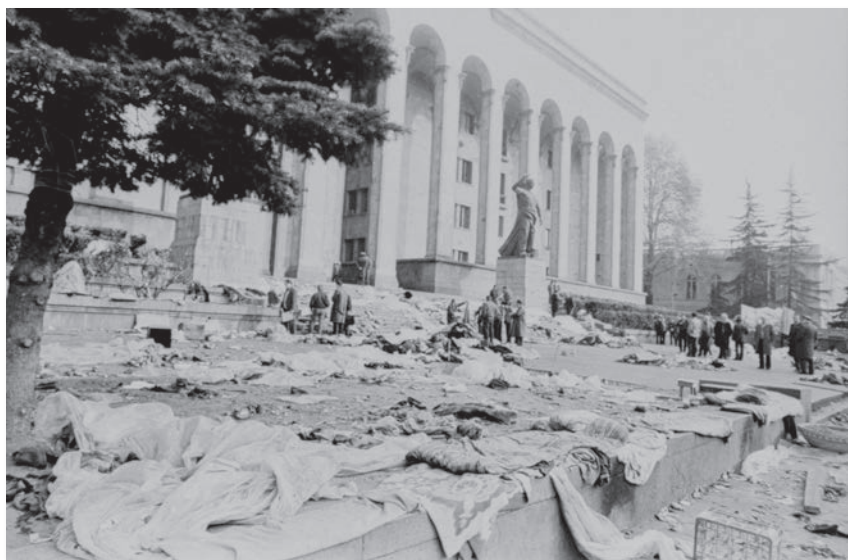
Dimineața zilei de 9 aprilie 1989

atunci 19 persoane, mai târziu au decedat încă două. Peste două mii de persoane au fost otrăvite. După 9 aprilie însă lupta georgienilor pentru independența națională nu a fost stopată ci, din contră, s-a intensificat.