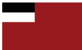
Vechiul steag al Republicii Democratice Georgia

În planul reformelor în domeniul culturii și învățământului, încă din a doua jumătate a secolului al XIX-lea, georgienii ceruseră deschiderea unei universități la Tbilisi, dar guvernul rus le refuzase solicitarea. După Revoluția din 1917 însă, la 8 februarie 1918, va fi înființată prima Universitate din