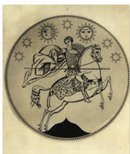
Stema Republicii Democratice Georgia (Arhiva Națională a Georgiei)

În februarie 1919 au avut loc alegeri pentru Adunarea Constituantă a Republicii Democratice Georgia, organul legislativ suprem al acesteia, scrutin la care au participat inclusiv femei. Alegerile au fost câștigate de social-democrați la scor, aceștia obținând 109 mandate, din care cinci au fost câștigate de femei. Restul mandatelor până la totalul de 130 de locuri ale Adunării Constituante au fost distribuite opoziției. Tot atunci, Karlo Ciheidze a fost ales președinte al Adunării Constituante. În luna iulie 1919 s-a înființat forul legislativ suprem al Republicii Democratice Georgiene, respectiv senatul. În procesul de edificare instituțională a republicii, o atenție deosebită a fost acordată reformelor în justiție și înființării curților de justiție. De asemenea, anterior, în septembrie 1918, fusese aprobat și drapelul tricolor de stat al Georgiei, simbol esențial în afirmarea statalității și independenței georgienilor. Stema oficială era compusă din reprezentarea Sfântului Gheorghe luptând cu balaurul, înconjurat de șapte corpuri cerești. Tot în luna iulie 1919, guvernul georgian își lansa propria monedă provizorie, care, deși nu se putea substitui deocamdată celorlalte valute forte, se va bucura totuși de un curs pozitiv prin comparație cu monedele din țările vecine. Acest aspect va contribui substanțial la fondarea Băncii de Stat a Republicii Democratice Georgiene, nu mai târziu de decembrie 1919.