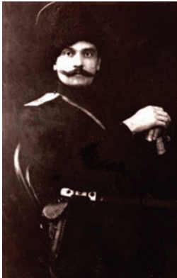
Generalul Ghiorgi Mazniașvili (6 aprilie 1870–16 decembrie 1937)

Dincolo de cazurile menționate anterior, situații problematice vor apărea și în sud-vestul teritoriilor georgiene. Astfel, conform Tratatului de pace de la Brest-Litovsk, semnat în martie 1918, Rusia renunțase la Batumi, Kars și Ardahan în favoarea Turciei. După declararea georgiană a independenței la 4 iunie 1918, Georgia a semnat și ea un acord cu Turcia privind reglementarea frontierei comune în sud. După înfrângerea Turciei la sfârșitul Primului Război Mondial, ca urmare a încetării ostilităților și semnării Armistițiului de la Moudros, Turcia era nevoită să părăsească raioanele Batumi, Kars și Ardahan, care însă nu se întorceau la Georgia, ci au fost ocupate de Marea Britanie, jurisdicția georgiană nefiind restabilită până în vara anului 1920.