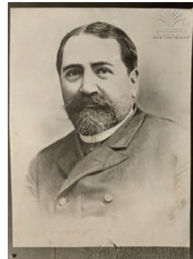
Ilia Ceavceavadze 8 noiembrie 1837- 12 septembrie 1907 (Biblioteca Națională a Parlamentului Georgiei)

Ilia Ceavceavadze și susținătorii săi din Tergdaleulebi au adus o contribuție însemnată la modernizarea Georgiei și prin înființarea „Băncii Nobililor” la Tbilisi (1875) și în Kutaisi (1876), care a constituit un pilon de sprijin pentru mica nobilitate. Mare parte din rândul acesteia, după desființarea șerbiei, se confruntau cu sărăcia și era forțată să-și vândă posesiunile, care ajungeau să fie cumpărate la prețuri de nimic de către străini, în special de armeni. Înființarea băncilor mai sus-amintite a oferit posibilitatea acestor nobili aflați în nevoie