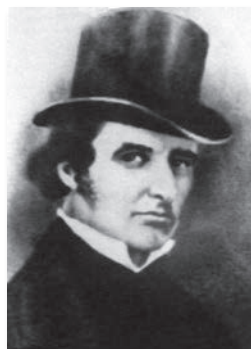
Solomon Dodașvili — unul dintre principalii participanți la revolta din 1832

După circa 30 de ani de încercări nereușite, elita georgiană care se afla în fruntea mișcării de rezistență națională a ajuns la concluzia că perspectiva reușitei unei revolte era nerealistă și a decis să abandoneze pozițiile de forță în favoarea unora mai indulgente. Astfel, a acceptat să intre în serviciul imperial, ceea ce a fost privit ca un aspect pozitiv și de către autoritățile țariste.