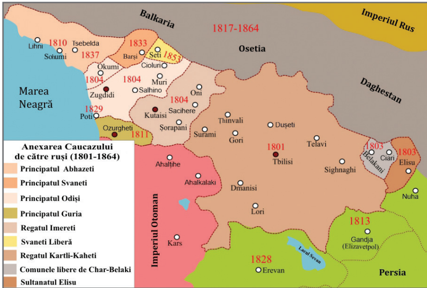
Anexarea Caucazului de către Imperiul Rus.