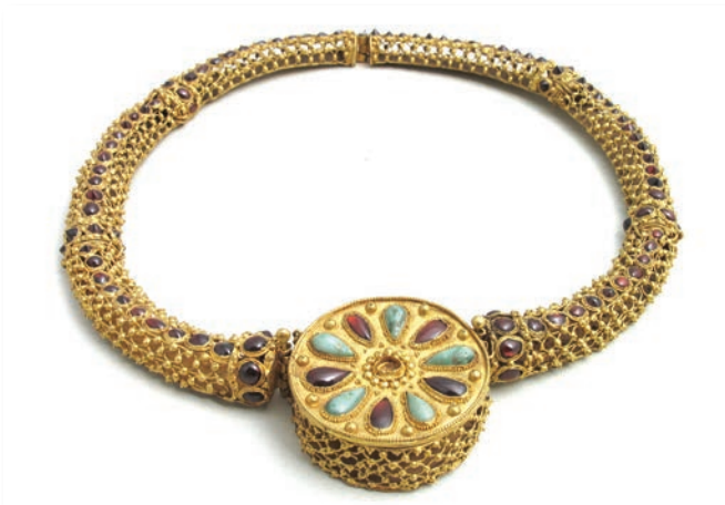
Colan de aur cu pietre prețioase, secolele II-III (Muzeul Național al Georgiei)

După moartea lui Hadrian, relațiile dintre Regatul Kartliei (Iberia) și Roma s-au relaxat întrucâtva și vor cunoaște o îmbunătățire odată cu recunoașterea de către noul împărat roman, Antoninus Pius (138–161), a extinderii posesiunilor kartliene dinspre Vest și asupra unor teritorii din zona de coastă a Mării Negre. Astfel, regele Parsman al II-lea 55 va da curs, de