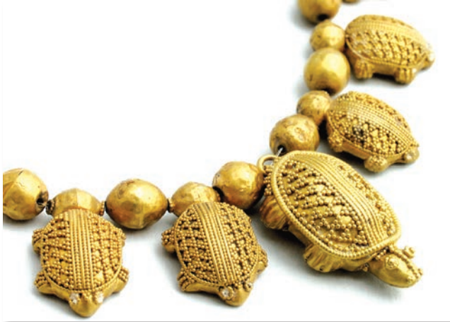
Colan de aur, secolul al V-lea î.Hr. (Muzeul Național al Georgiei)

Așadar, referitor la Regatul Colchidei, mitologia, relatările istorice și vestigiile arheologice se completează pentru a ne reda imaginea unui stat dezvoltat, atât politic, cât și economic, cu o cultură înfloritoare și având relații strânse cu lumea civilizată contemporană lui.