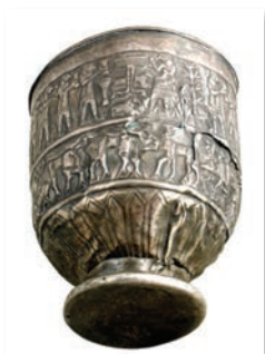
Cupă din argint, mileniul al II-lea î.Hr. (Muzeul Național al Georgiei)