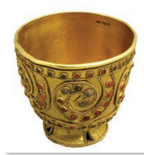
Cupă de aur, mileniul al II-lea î.Hr. (Muzeul Național al Georgiei)