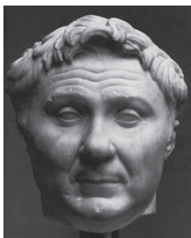
Cneus Pompeius Magnus (106-48 î.Hr.)

controlau Strâmtoarele, nu își puteau exercita însă pe deplin puterea și influența și în Marea Neagră, unde principalul lor rival era Regatul Pontului. În perioada în care a fost condus de Mitridate al VI-lea Eupator (119-63 î.Hr.) 51 , cunoscut și sub numele de Mitridate cel Mare, Regatul Pontului, care includea și Colchida, și triburile din vestul teritoriului georgian de astăzi, ajunsese să controleze aproape în întregime bazinul Mării Negre, cu excepția țărmului ei vestic, devenind un obstacol în calea expansiunii Romei. Astfel, între Roma, al cărei obiectiv era de a controla și zona costieră din Marea Neagră ce aparținea Regatului Pontului, având și o mare importanță