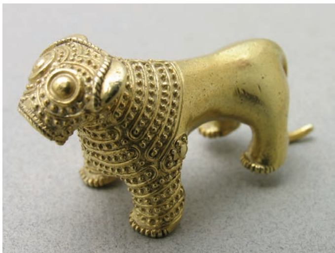
Statuetă Leul de Aur, mileniul al III-lea î.Hr. (Muzeul Național al Georgiei)