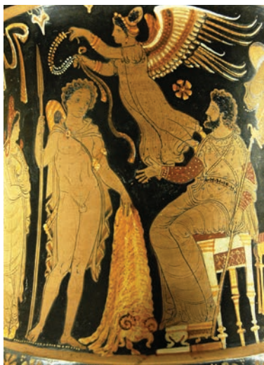
Întoarcerea lui Iason cu Lâna de aur, reprezentată pe un vas de ceramică antică din Apulia

confruntările cu asirienii și urartienii i-au grăbit declinul, iar în cele din urmă a sfârșit prin a fi cucerit de vecinul de la nord, Regatul Colchidei.