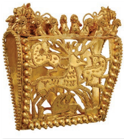
Bijuterie de aur, a doua jumătate a secolului al IV-lea î.Hr. (Muzeul Național al Georgiei)

Imperiul fondat de Alexandru cel Mare, chiar dacă s-a destrămat imediat după moartea acestuia în mai multe regate, a constituit o bază solidă pentru răspândirea limbii și culturii grecești și în rândul altor națiuni, contribuind totodată la consolidarea și dezvoltarea legăturilor comerciale dintre vechiul Orient și matca civilizației grecești. Aceste evoluții au deschis lumii antice calea către „epoca elenistică”, perioadă cuprinsă între anul 323 î.Hr., după moartea lui Alexandru, și anul 31 î.Hr., când moare regina egipteană Cleopatra a VII-a, iar Octavian anexează Egiptul și devine primul împă-