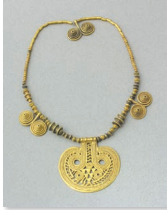
Colier de aur, a doua jumătate a mileniului al III-lea (Muzeul Național al Georgiei)