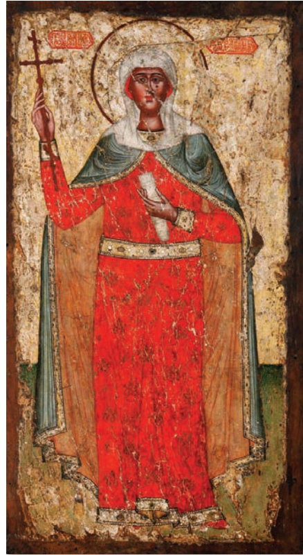
Sfânta Nino, secolele XVII–XVIII (Muzeul Național al Georgiei)

Creștinarea efectivă a georgienilor și recunoașterea creștinismului ca religie de stat în Regatul Kartliei au loc pe parcursul secolului al IV-lea d.Hr., după sosirea aici a Sfintei Nino de Capadocia. Lucrările hagiografice care ne vorbesc despre viața Sfintei Nino ne spun că Sfânta s-ar fi rugat lui Dumnezeu cu ocazia sărbătorii păgâne dedicate zeului Armazi și că un fulger ar fi lovit și distrus atunci idolii păgâni ai acestuia, pe Gaț și Gaim. După această întâmplare, Sfânta Nino a rămas în Mțheta unde a predicat creștinismul și a tămăduit bolnavii, vindecând-o inclusiv pe regina Nana, cea de a doua soție a regelui Mirian al Kartliei, care suferea de o boală gravă, și care, salvată fiind, se convertește la creștinism. În scurt timp și regele Mirian acceptă să se creștineze, deși inițial era un opoent al creștinismului. În acest sens, legenda ne spune că regele ar fi plecat cu escorta la vânătoare și că