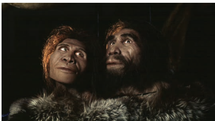
Zezva și Mzia — „primii europeni”, datează de 1,7–1,8 milioane de ani (Muzeul Național al Georgiei)

De asemenea, în afară de descoperirile referitoare la grupul Homo Erectus , pe teritoriul Georgiei au fost găsite și oseminte, și vestigii arhaice aparținând lui Homo Neanderthalensis și lui Homo Sapiens .