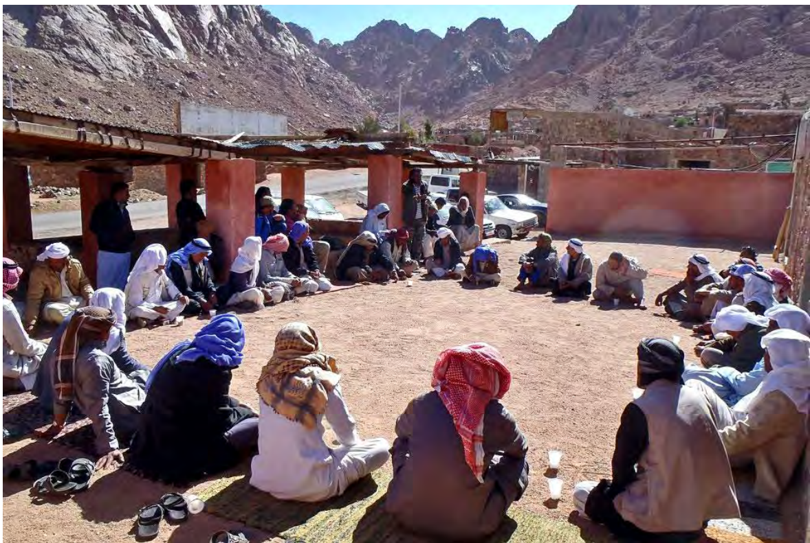
Fig. 3. Adunare de beduini Jebeliya.