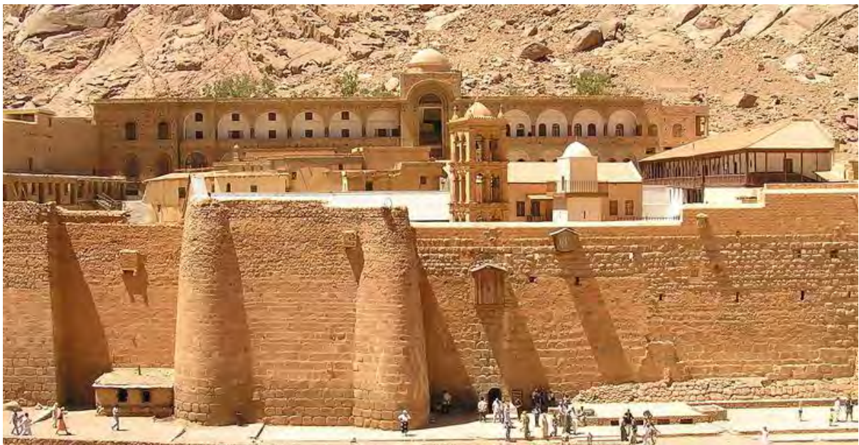
Fig. 5. Mănăstirea Sfânta Ecaterina din Sinai.