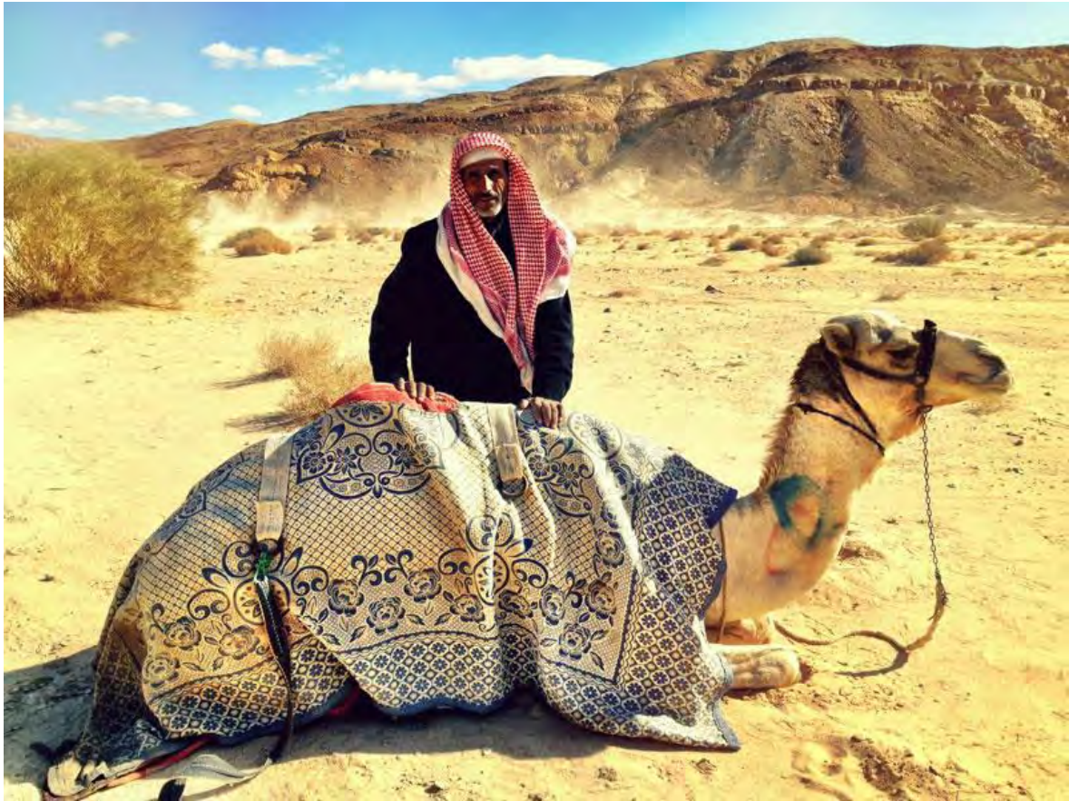
Fig. 2. Beduin Jebeliya.