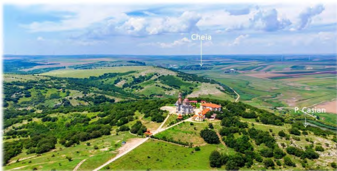
Fig. 1. Peștera Casian – localizare geografică.

Cercetările arheologice întreprinse în cadrul proiectului academic româno-polon Study of the Prehistoric and Early Mediaeval Settlements in the Casimcea River Valley in Central Dobruđa au făcut posibilă atât reluarea săpăturilor arheologice în peșteri bine cunoscute din zona Cheile Dobrogei – Peștera La Izvor , Peștera La Baba și Peștera Casian –, cât și extinderea investigațiilor în grote necercetate. Coroborând descoperirile arheologice, izvoarele literare și epigrafice vechi cu cercetările recente, considerăm necesară reluarea în discuție a subiectului privind locuirea acestui loc legendar – Peștera Casian (Fig. 1).