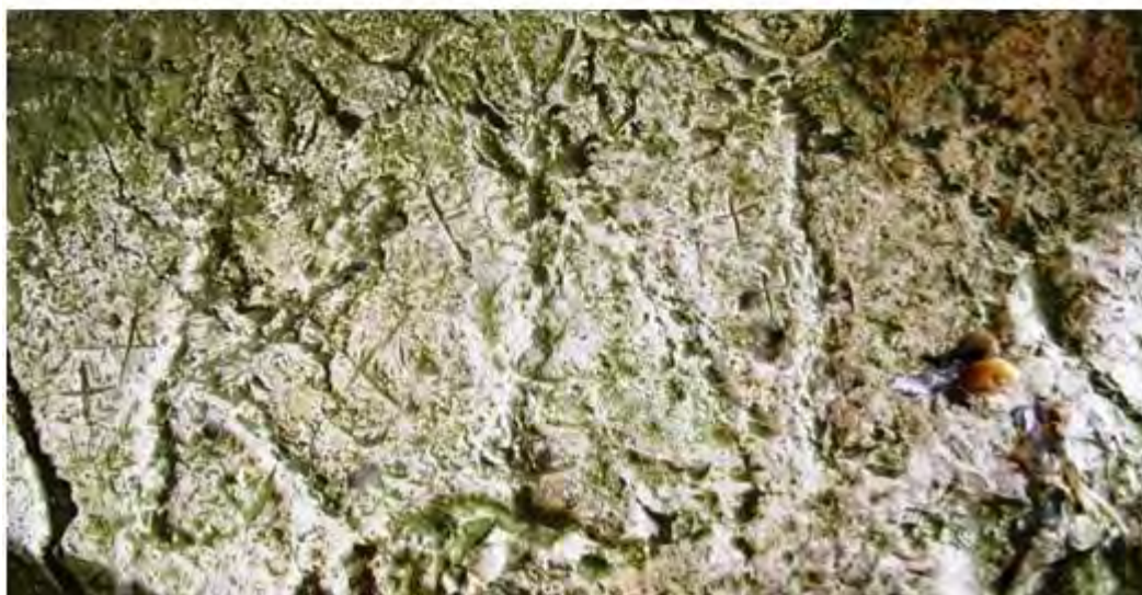
Fig. 5-6. Cercetările întreprinse în cadrul proiectului româno-polon Study of the Prehistoric and Early Mediaeval Settlements in the Casimcea River Valley in Central Dobrudja