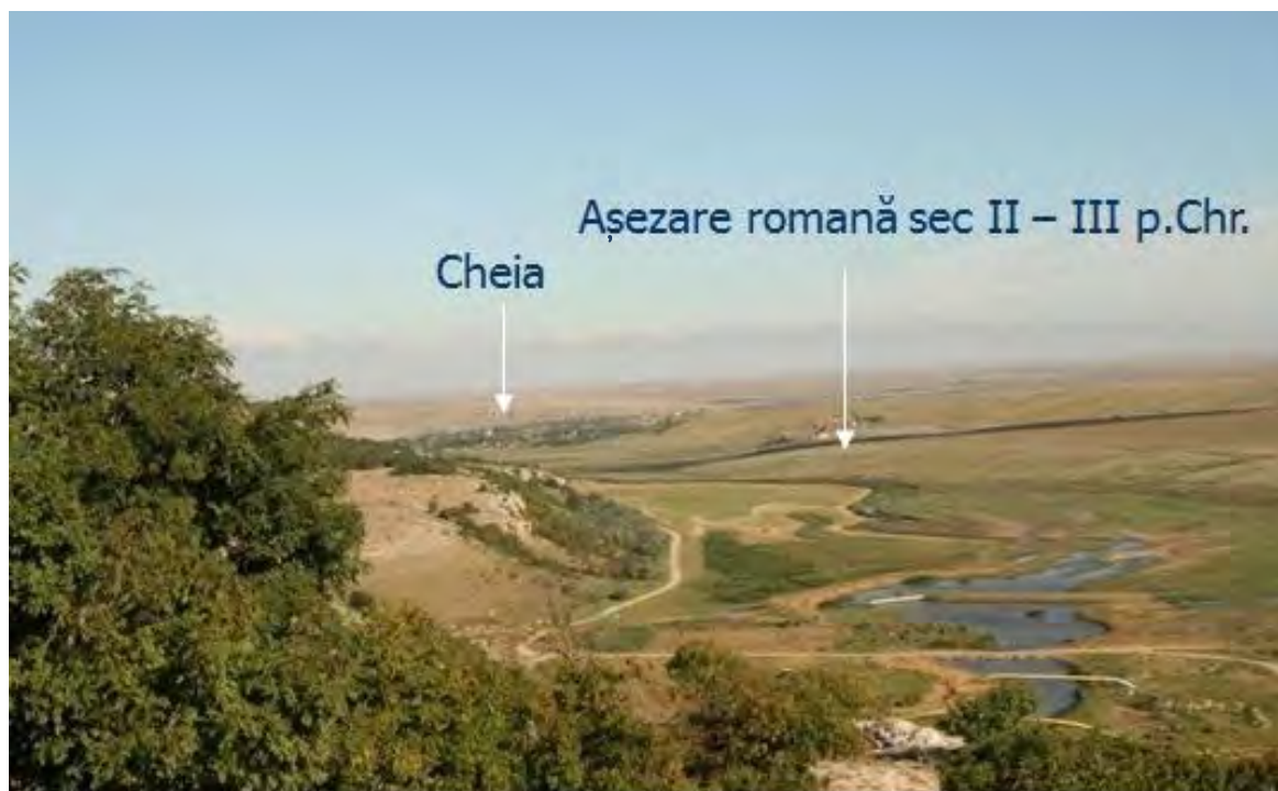
Fig. 4. Așezare romană (sec. II-III p.Chr.) – localizare spațială.

Coroborând toate aceste informații literare și epigrafice cu descoperirile arheologice, în stadiul actual al cercetărilor pot fi formulate câteva concluzii. Vicus Casianus a existat cu certitudine în această microregiune, încă din secolele II-III p.Chr., conform datării celor trei inscripții. Considerăm plauzibilă situarea acestui vicus în vecinătatea „pietrelor scrise”, descoperite in situ . De aceea, propunem identificarea lui cu cea mai apropiată așezare romană timpurie descoperită în zonă, până în prezent, respectiv la marginea de SE a satului Cheia (Fig. 4).