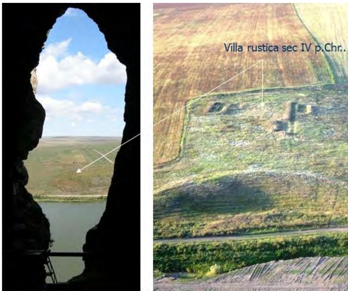
Fig. 3. Villa rustica (secol IV p.Chr.).

În urma cercetărilor de suprafață a fost localizat al doilea sit, respectiv o așezare romană timpurie – vicus? (secolele II-III p.Chr.), situată tot pe malul stâng al Casimcei, la aproximativ 1,5 km vest de villa rustica și la marginea de sud-est a satului Cheia (Băjenaru C., 2002, 2003). Până în prezent, aceasta este cea mai apropiată așezare contemporană cu cele două inscripții, ceea ce ne sugerează o posibilă localizare a satului vicus Casiani (Fig. 4).