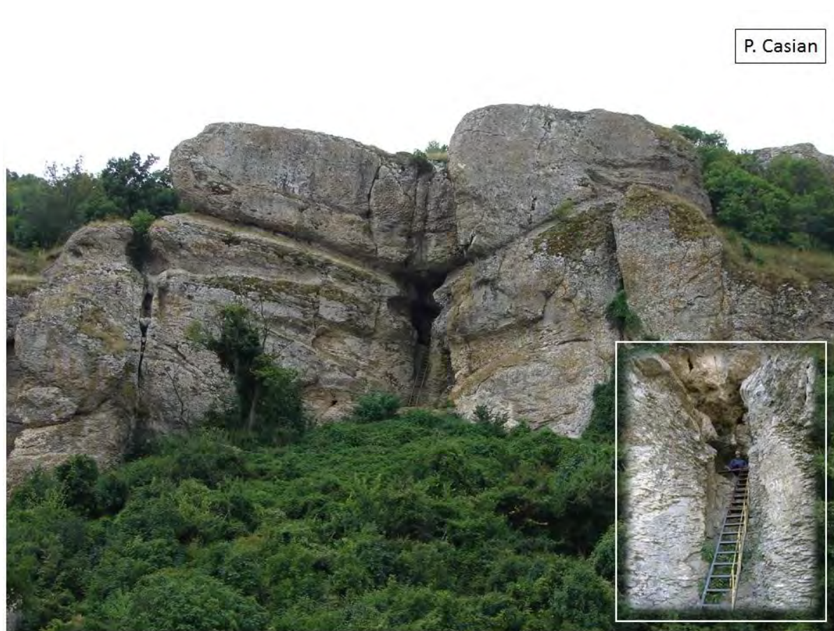
Fig. 2. Peștera Casian.

analogiilor cu semnele descoperite în complexul rupestru de la Dumbrăveni (Chiriac C., 1988-1989), cercetătorii au propus datarea lor între secolele IX-XI p.Chr. Următorul detaliu, „o cruciuliță zgâriată deasupra unei firide special amenajate pentru opaițe, locaș situat tot pe peretele din stânga intrării în peșteră”, constituie un indiciu privind locuirea peșterii de către călugări. Astfel, se afirma pentru prima dată într-un studiu arheologic posibilitatea existenței unei comunități monahale în zona Casian: „certifică existența unui mic așezământ monahal în secolul al X-lea, foarte probabil după revenirea bizantină la Dunăre” (Mihăilescu-Bîrliba L., Diaconescu M., 1991).